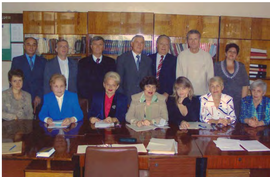
Коллектив кафедры истории славян ДонНУ