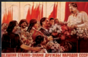
И. В. СТАЛИН — ЗНАМЯ ДРУЖБЫ НАРОДОВ СССР