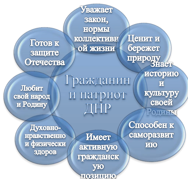
Схема 1. Модель «Гражданина и патриота Донецкой Народной Республики»

Младший школьный возраст – самая благодатная пора для нравственного становления и развития личности, формирования ее гражданской идентичности. Это определило необходимость создания модели социального субъекта как функционального идеала в рамках реализации программы: