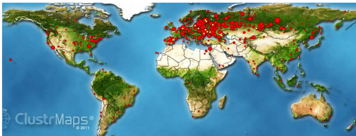
Рис. 2. Карта заходов на сайт Института Культуры ДонНТУ. Самый малый круг – до десяти человек в месяц из данного региона. Самый большой круг – более 1000 человек/месяц из этого города/местности.

С программой, библиотекой, дистанционными курсами, конкурсами знакомьтесь на сайте Института Культуры ДонНТУ [19].