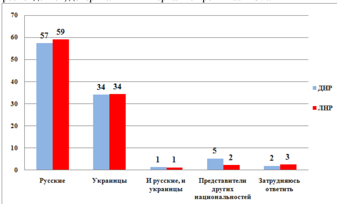
Рис. 2. Этническая самоидентификация жителей ДНР и ЛНР в мае 2016 г. (%)

Рис. 2 представляет итоги ответов на вопрос по этнической самоидентификации по ДНР и ЛНР: по каждой республике было опрошено по 1000 респондентов, доверительный интервал не превышает \pm 3\% .