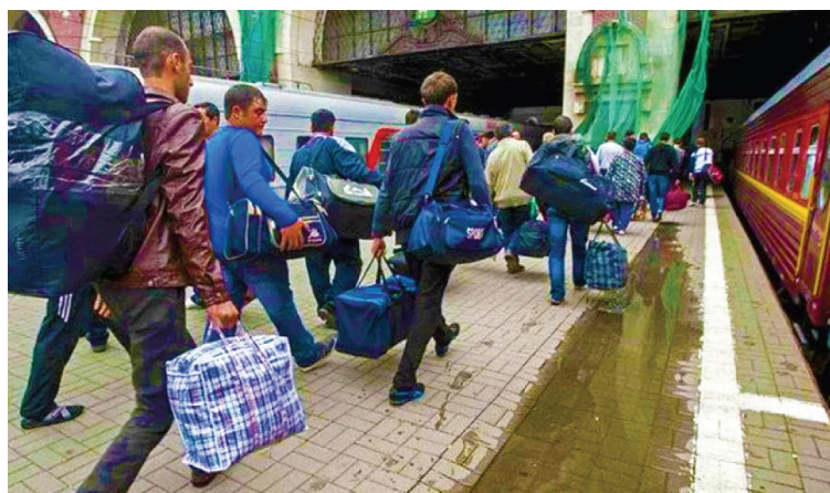
■ Трудовая миграция

В некоторых ситуациях выгоднее было называть себя украинцем как представителем титульного этноса в мононациональном государстве. Возможно, сыграла свою роль и трудовая миграция части населения в Россию, прежде всего тех, у кого там были родственники и связи.