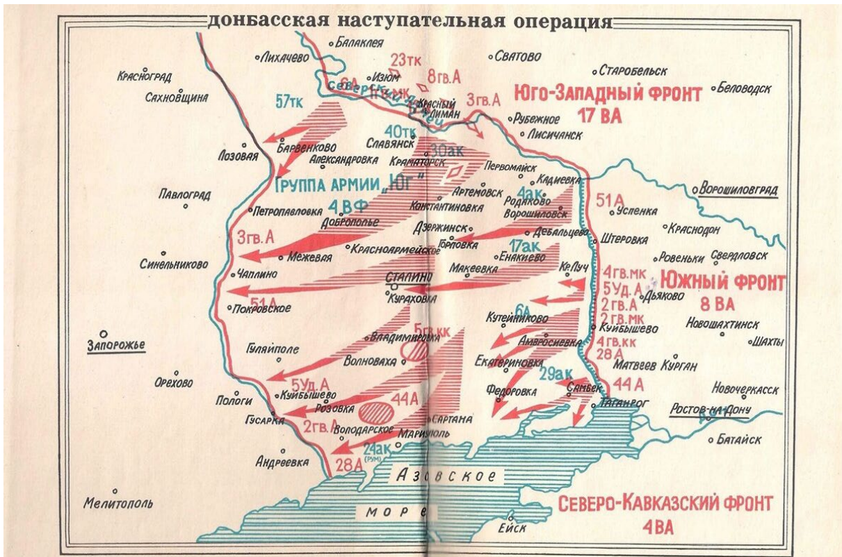
■ Карта «Донбасская наступательная операция в августе-сентябре 1943 г.»

В сентябре 1943 г. вся территория Донбасса была освобождена от немецко-фашистских захватчиков. Из 1311 предприятий, работавших в Донбассе до войны, осталось только 61. Все 882 шахты бассейна были разрушены и затоплены. Началось время трудового подвига – восстановление промышленности в рекордно короткие сроки. Уже к концу 1943 г. беспримерными усилиями шахтеров, большинство которых составляли женщины, было добыто более 4 млн тонн угля.