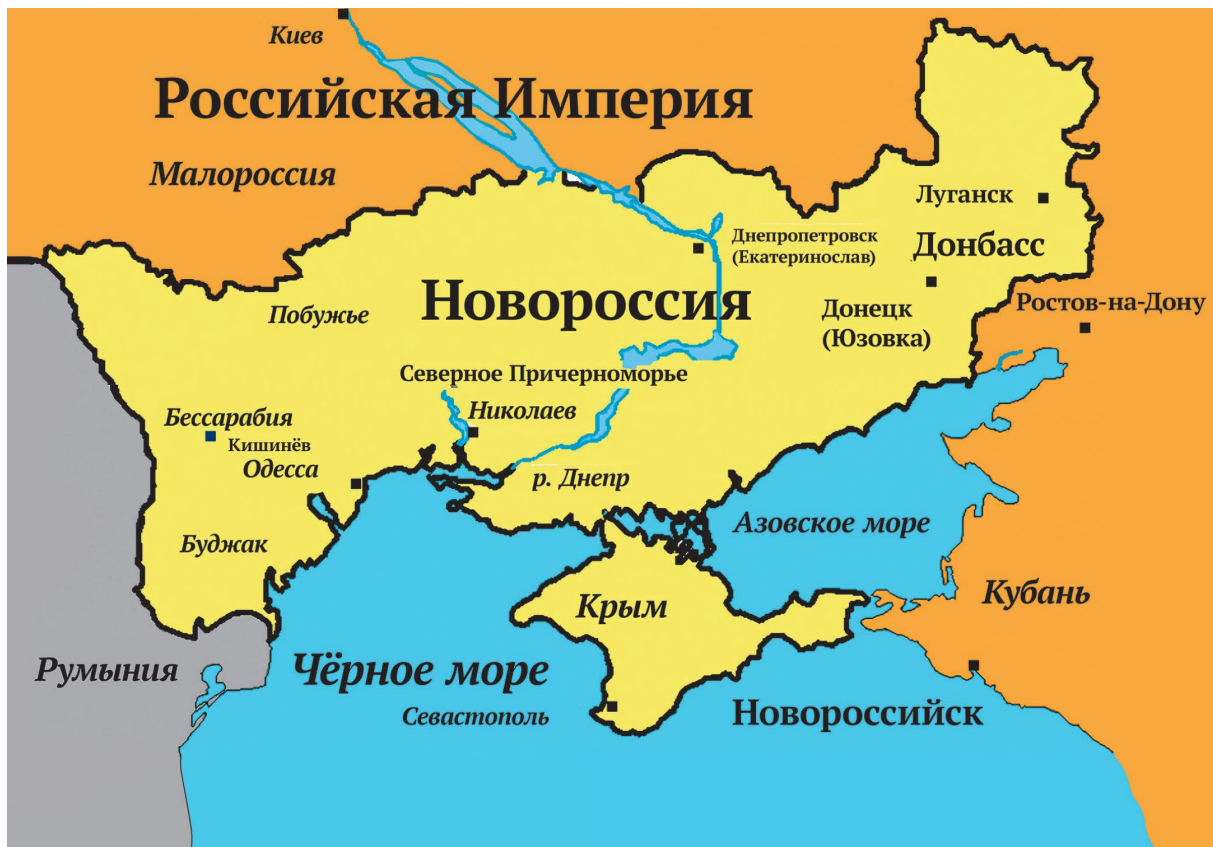
■ Карта территории Новороссии в XVIII в.

В 1775 г. из присоединенных земель Бахмутской провинции Новороссийской губернии и Земель Войска Донского была сформирована Азовская губерния.