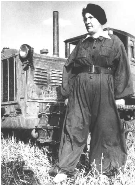
■ Первая в мире женщина тракторист Прасковья Ангилина (1936 г.)

В 1940 г. Донбасс давал 60 % общесоюзной добычи угля. Перед Великой Отечественной войной на донецком угле работало около 60 % предприятий металлургии и железнодорожного транспорта страны, около 70 % всей химической промышленности, около 50 % электростанций СССР.