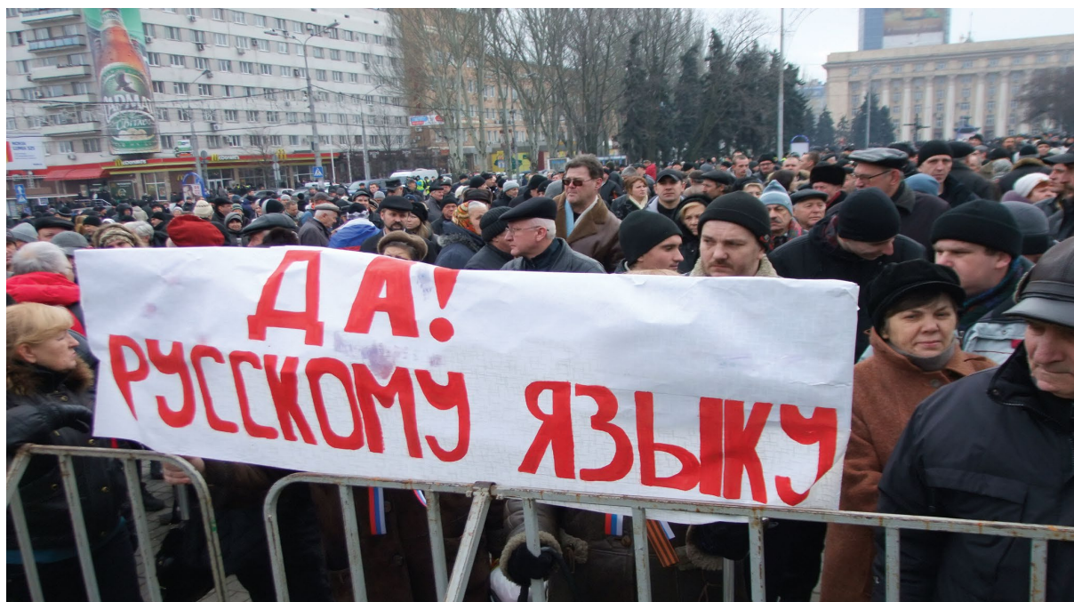
■ Русский – национальный язык народа Донбасса

Важным является то, что родной язык выступает в качестве средства национальной самоидентификации, которое, в отличие от всех других средств национальной самоидентификации, сопровождает человека на протяжении всей жизни. Подавляющее большинство людей, живущих в Донбассе, использует в качестве родного русский язык, тем самым идентифицируя себя как русских, независимо от того, к какой этнической группе «по наследованию» они себя относят. Поэтому русский язык определяется как русский национальный язык Донбасса – язык русской политической нации.