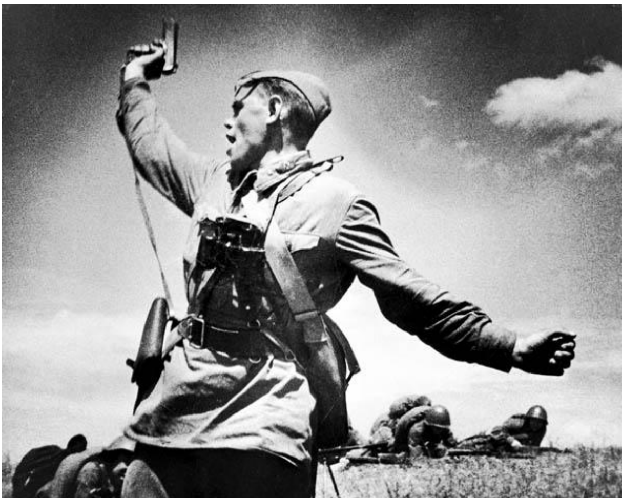
■ Фотография «За Родину!». Оборонительные бои в Донбассе

В годы Великой Отечественной войны Донбасс стал одним из важнейших регионов Советского Союза, в котором ковалась победа над фашизмом. Из рабочих Донбасса формировались боеспособные подразделения. В первые недели войны в Сталинской области было призвано в ряды Красной армии 236 тыс. человек. Ускоренными темпами были полностью сформированы 383-я, 393-я и 395-я стрелковые дивизии. В их состав призывались шахтеры, в комплектовании и оснащении принимали участие все местные органы власти, трудовые коллективы угольных предприятий, семьи горняков. Поэтому за дивизиями закрепилось название «шахтерские», хотя в официальных формулярах частей оно не значится. Шахтерские стрелковые дивизии приняли участие в обороне Донбасса и прошли достойный боевой путь, внося свой вклад в победу над захватчиками.