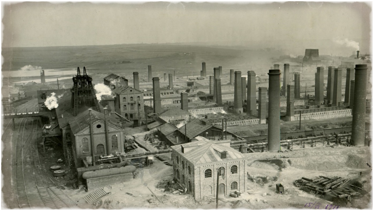
■ Юзовский металлургический завод в XIX в.

Длина Донецкой каменноугольной железной дороги достигла 479 верст, центральной станцией было Дебальцево. Дорогу построил знаменитый предприниматель Савва Мамонтов. В 1878 г. были открыты три участка: Никитовка – Дебальцево – Должанская; Дебальцево – Попасная – Краматорское и Дебальцево – Луганский завод. На территории Луганского завода построен вокзал, создано управление железной дороги, а рядом со станцией заложено железнодорожное училище.