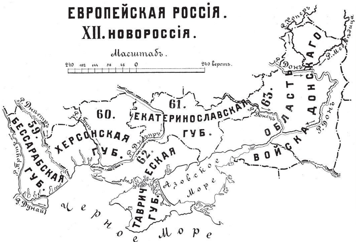
■ Карта Европейской России в XIX в.

В 1802 г. на землях Войска Донского были образованы 8 округов и Калмыцкое кочевье. Часть Донбасса входила в состав земли Войска Донского.