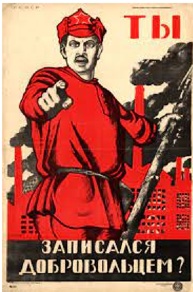
■ Агитационный плакат Красной армии (1920 г.)

Революционные события в начале XX в. стали важной частью в истории Донбасса. Немаловажно, что эти события проходили в рамках общерусской истории. В декабре 1905 г. почти параллельно с событиями в Москве в поселке Горловка вспыхнуло восстание шахтеров и металлургов. Через 12 лет Донбасс вновь оказался в водовороте революционных событий. В феврале-марте и октябре 1917 г. в Петрограде произошли два революционных переворота, которые в последующие годы привели к масштабной социальной революции и завершению истории Российской империи.