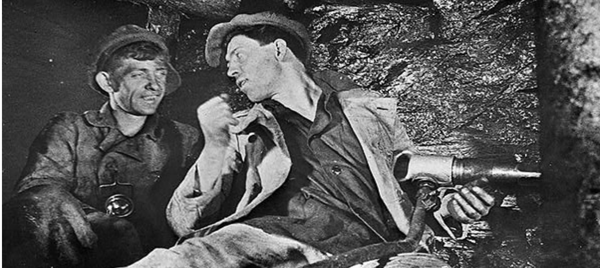
■ Трудовой подвиг шахтера Алексея Стаханова (1935 г.)