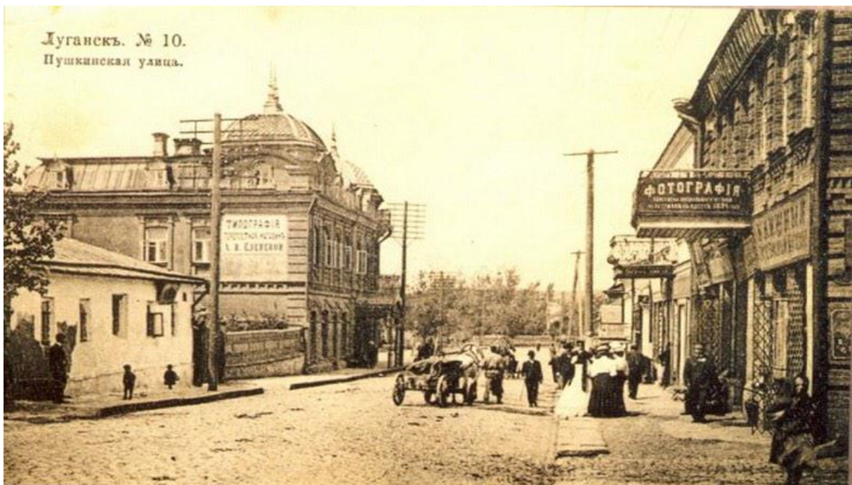
■ Луганск. Начало XIX в.

Во второй половине XIX в. происходит активное развитие и Луганска. В 1882 г. Луганский завод и поселок Каменный Брод были объединены в город Луганск, который стал новым центром Славяносербского уезда Екатеринославской губернии. Его население на тот момент составляло около 10 тыс. человек, а по итогам переписи 1897 г. в этом уездном городе проживало уже более 20 тыс. человек.