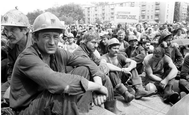
■ Забастовки шахтеров на Украине

8 декабря 1991 г. в Беловежской пуще под Брестом руководители Белоруссии (С. Шушкевич), России (Б. Ельцин), Украины (Л. Кравчук) подписали Соглашение о создании Содружества Независимых Государств (СНГ), которое аннулировало Договор 1922 г. об образовании СССР и закрепило его раздел. На месте СССР – наследника исторической России – возникли несколько государств, обладающих, с точки зрения западных стран и контролируемых ими международных институтов, абсолютными правами на доставшееся им наследие русского народа. В ходе приватизации государственного общенародного имущества верхушка этих государств стала правообладателями собственности, созданной всем народом Советского Союза.