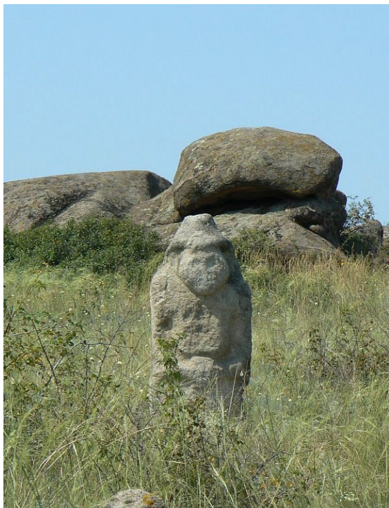
■ Половецкое каменное изваяние

Христианские жители Шарукани встретили русское воинство православными дарами. В этой части Половецкого Поля располагались владения ханов из династии Шаруканидов, которые поддерживали тесные военные, экономические и дипломатические связи с киевскими и черниговскими князьями, рождались и воевали с ними. Поход новгород-северского князя Игоря на вежи хана Кончака в 1185 г. воспет в эпической древнерусской поэме «Слово о полку Игореве». Поход закончился пленением князя Игоря в ставке хана Кончака на Торе (в районе совр. Славянска), бегством Игоря из плена и последующим династическим союзом.