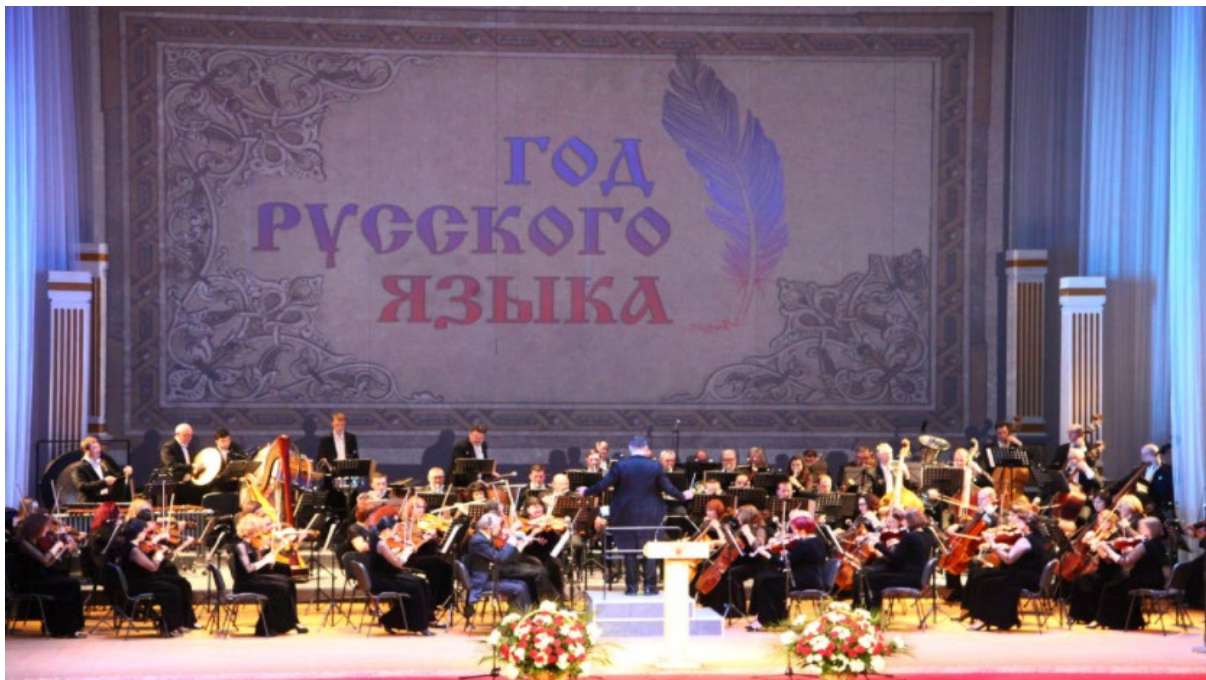
■ Торжественное открытие Года русского языка в ДНР (2019 г.)