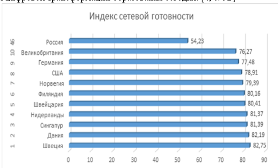
Рис. 2 - Рейтинг стран мира по индексу сетевой готовности по состоянию на 2021 г.

Как показывают исследования, несмотря на меры, реализуемые Правительством РФ, Россия сильно отстает от стран-лидеров, а также уступает многим странам, идущим по пути догоняющего развития. Цифровизация образования в нашей стране должна заполнить глобальный пробел цифровой трансформации образования сегодня. [4, с. 92]