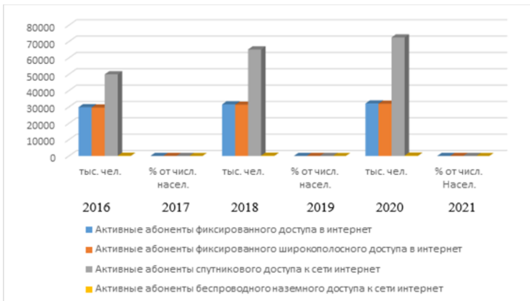
Рис. 1 - Число и доля активных абонентов РФ, имеющих доступ в Интернет

Согласно рейтингу по индексу сетевой готовности по состоянию на 2021 г. Россия занимает 46-е место.