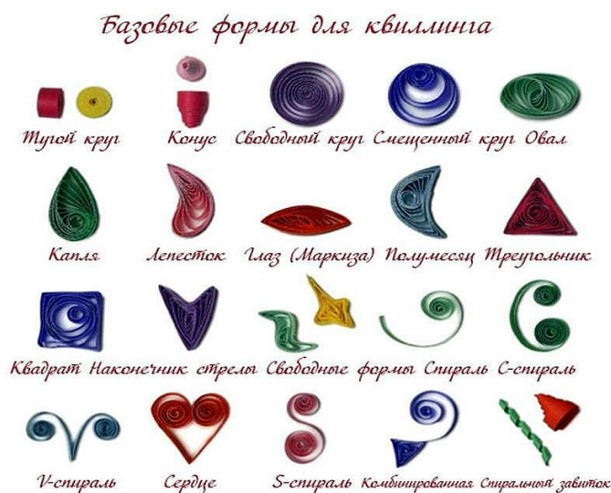
Рис. 1 - Базовые формы для квиллинга

Это отличный оригинальный подарок. Стоит отметить, что у обучающихся также формируются начальные навыки поисковой деятельности, умение работать осознанно и целеустремленно.