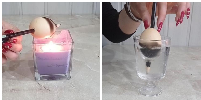
Рис. 5 (иллюзия «серебряная скорлупа»)

Вывод: из-за полного сгорания парафинов образуется вода и углекислый газ; после того, как скорлупа закоптилась, она стала «серебряной». Происходит это из-за отталкивания воды сажей и покрытия яичной скорлупы тонкой плёнкой воздуха, отражающей падающие лучи света. Вот почему кажется, что яйцо серебряное.