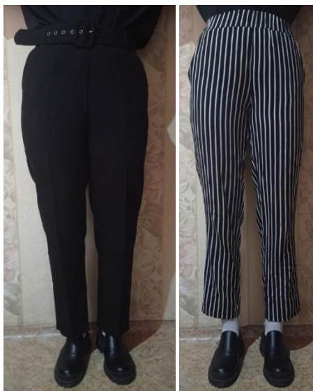
Рис. 1 (а) однотонные чёрные брюки; б) брюки в вертикальную полосу)

Замкнутый и незамкнутый контур в верхней части тела. Замкнутый контур, например, у водолазки, может не только укоротить шею, но также и уменьшить рост. Чтобы избежать этого, можно воспользоваться зрительной иллюзией и надеть кофту с V-образным вырезом.