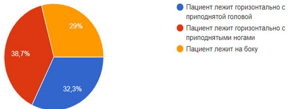
Рисунок 3. Противошоковое положение по мнению опрошенных

По результатам вопроса о противошоковое положение было выявлено, что 20 человек (32,3%) считают: при противошоковом положении пациент лежит горизонтально с приподнятой головой; 24 человека (38,7%) считают, что пациент лежит горизонтально с приподнятыми ногами, что является правильным вариантом ответов, и 18 человек (29%) выбирают, что пациент лежит на боку. Большое количество респондентов в данном вопросе выбрали неверный ответ, что говорит о низкой информированности и в последующем возможны неверные решения в оказании первой доврачебной помощи.