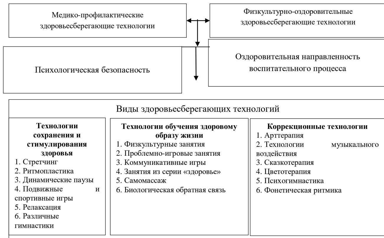
Рис. 1 – Виды здоровьесберегающих педагогических технологий

Качество здоровьесбережения определяется действием множества факторов, для предупреждения влияния которых необходима соответствующая здоровьесберегающая технология. При наличии соответствующей технологии, востребованы решения не отдельных задач, а реализация совокупности мер постоянного характера на процесс здоровьесбережения (см. рис. 1).