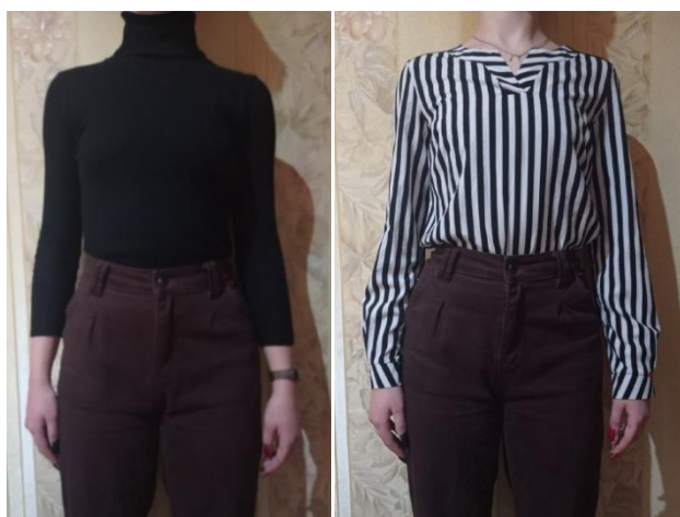
Рис. 2 (а) замкнутый контур – водолазка; б) блузка с V-образным вырезом)

Замкнутый и незамкнутый контур в верхней части тела. Замкнутый контур, например, у водолазки, может не только укоротить шею, но также и уменьшить рост. Чтобы избежать этого, можно воспользоваться зрительной иллюзией и надеть кофту с V-образным вырезом.