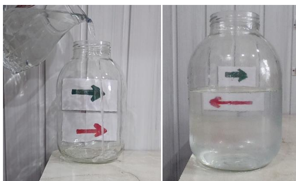
Рис. 4 (опыт-иллюзия с банкой воды и нарисованными стрелками)

Цель: создать иллюзию и понять причину её возникновения