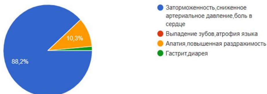
Рисунок 2. Последствия анафилаксии по мнению респондентов

Последствиями анафилаксии является «заторможенность, сниженное артериальное давление, боль в сердце» такой ответ выбрали 60 человек (88,2%), 7 человек (10,3%) считают «апатия, повышенная раздражимость» - является верным ответом для последствия анафилаксии, а 1 человек (1,5%) считает, что «гастрит, диарея» - говорит об анафилаксии, вариант ответа «выпадение зубов, атрофия языка» никем не был выбран. Правильным ответом являлось «заторможенность, сниженное артериальное давление, боль в сердце», другие варианты ответов были ложными и не характерны для анафилаксии, необходимо уделить этому моменту внимание в просветительской деятельности.