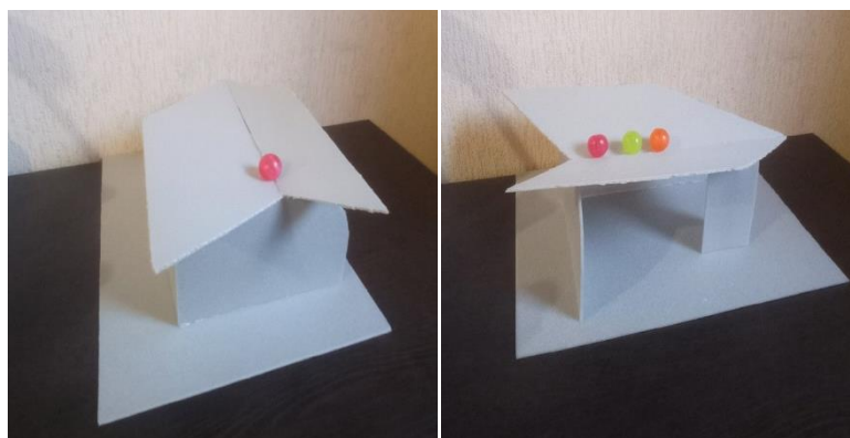
Рис. 3 (самодельная иллюзия восприятия глубины)

Вывод: благодаря освещению и ракурсу крыша объекта выглядела выпуклой, но после того, как поменялся угол наблюдения – крыша стала вогнутой, какой она является на самом деле.