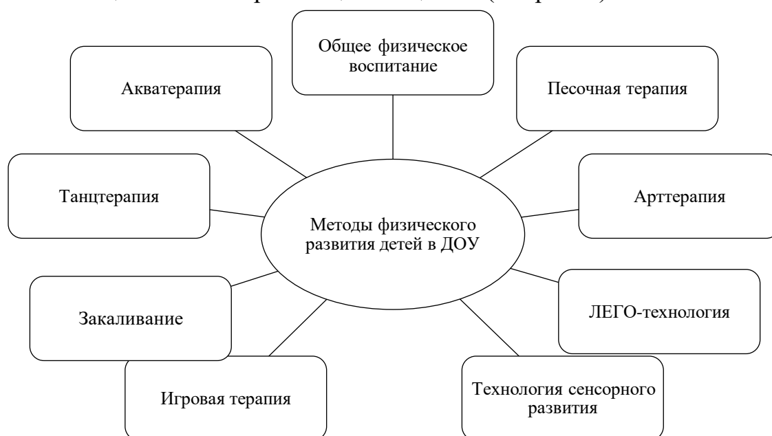
Рис. 2 - Модель реализации педагогических средств по физическому развитию детей старшего дошкольного возраста в дошкольном образовательном учреждении

Модель работы по физическому развитию детей дошкольного возраста в ДОУ, является процессом учебно-воспитательной деятельности по формированию индивидуальных проявлений отношения личности к своему здоровью, соответствующей ценностной ориентацией индивида в соответствии с тем местом, которым он отводит своему здоровью в системе ценностей и ценностных ориентаций общества (см. рис. 2).