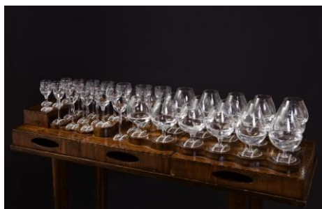
Рис.1- Стеклянная арфа.

Когда один объект вибрирует на частоте второго объекта, тогда первый заставляет второй вибрировать с высокой амплитудой. Так возникает акустический резонанс. Примером служит игра на любом музыкальном инструменте. В начале 17 века человек научился создавать из стекла тонкие изделия и заметил, что если провести пальцем по краю влажного бокала, то появится тянущийся звук. Так появился инструмент «Стеклянная арфа» - она состояла из 30 или 40 бокалов наполненных разным количеством воды. [3]