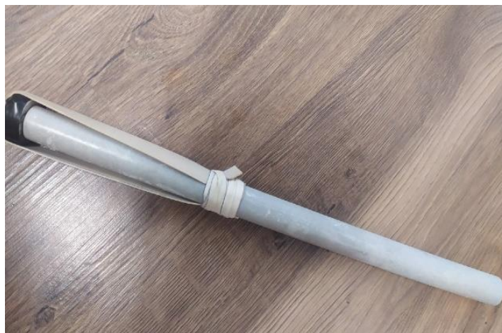
Рис. 2. - Модель в готовом виде

играющую роль ствола, я закрепил бинт резину, во внутрь вставил металлопластиковый поршень и на ограничитель одел бинт резину.