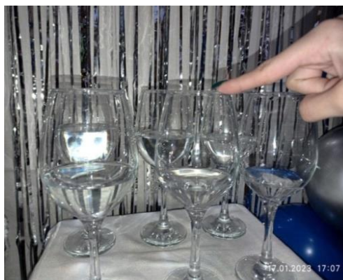
Рис. 2. - Поющие бокалы с разным количеством воды

Вывод: тон звука зависит от количества воды в бокалах , чем больше воды , тем ниже тон звука и наоборот. Если бокал узкий из тонкого стекла ,звук будет более высокий , а широкий из толстого – низкий.