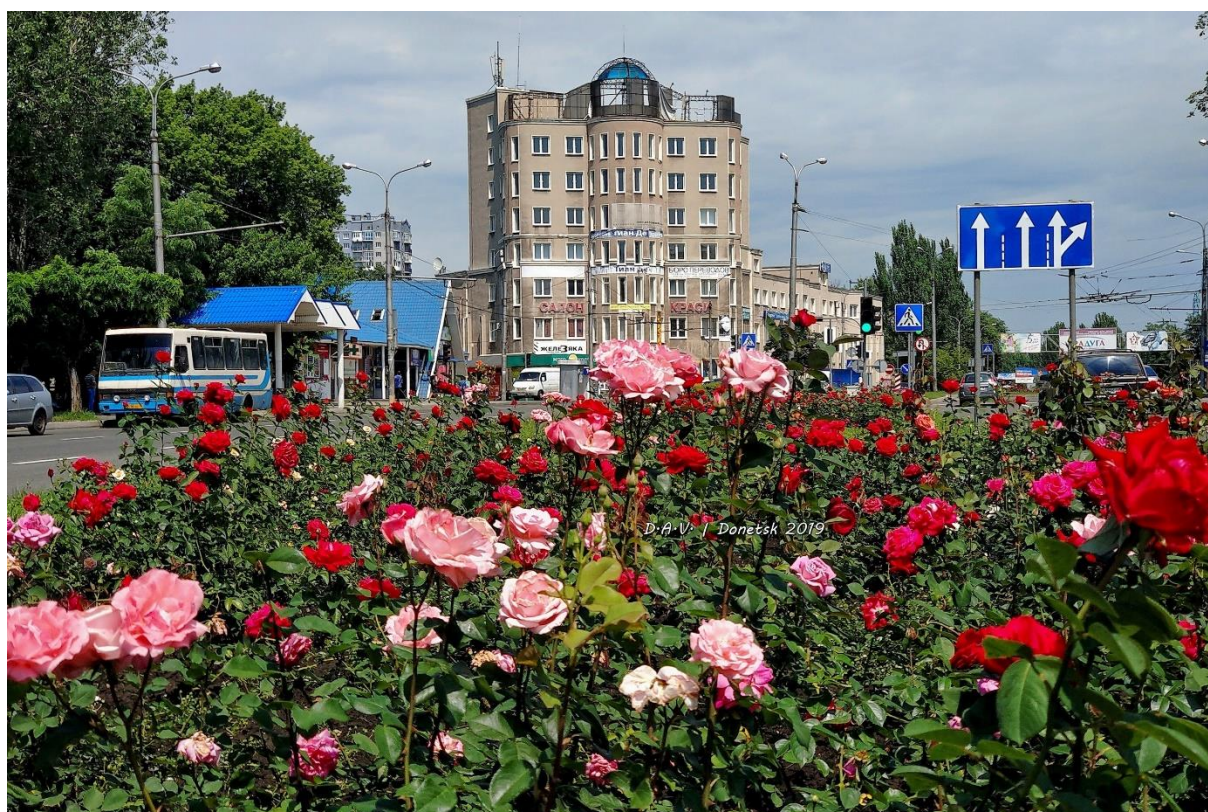
Рисунок 14. Донецк – город миллиона роз. Ольга Флусова. Фото 2019 г.

15. Вот такая история с розами Донецка. Сколько их осталось, никто не считал. Сейчас гибнут и розы, и люди. Но история ещё не закончилась. Мы уверены, что количество роз и количество жителей Донецка рано или поздно совпадут на отметке «миллион» и начнут прирастать и людьми, и цветами