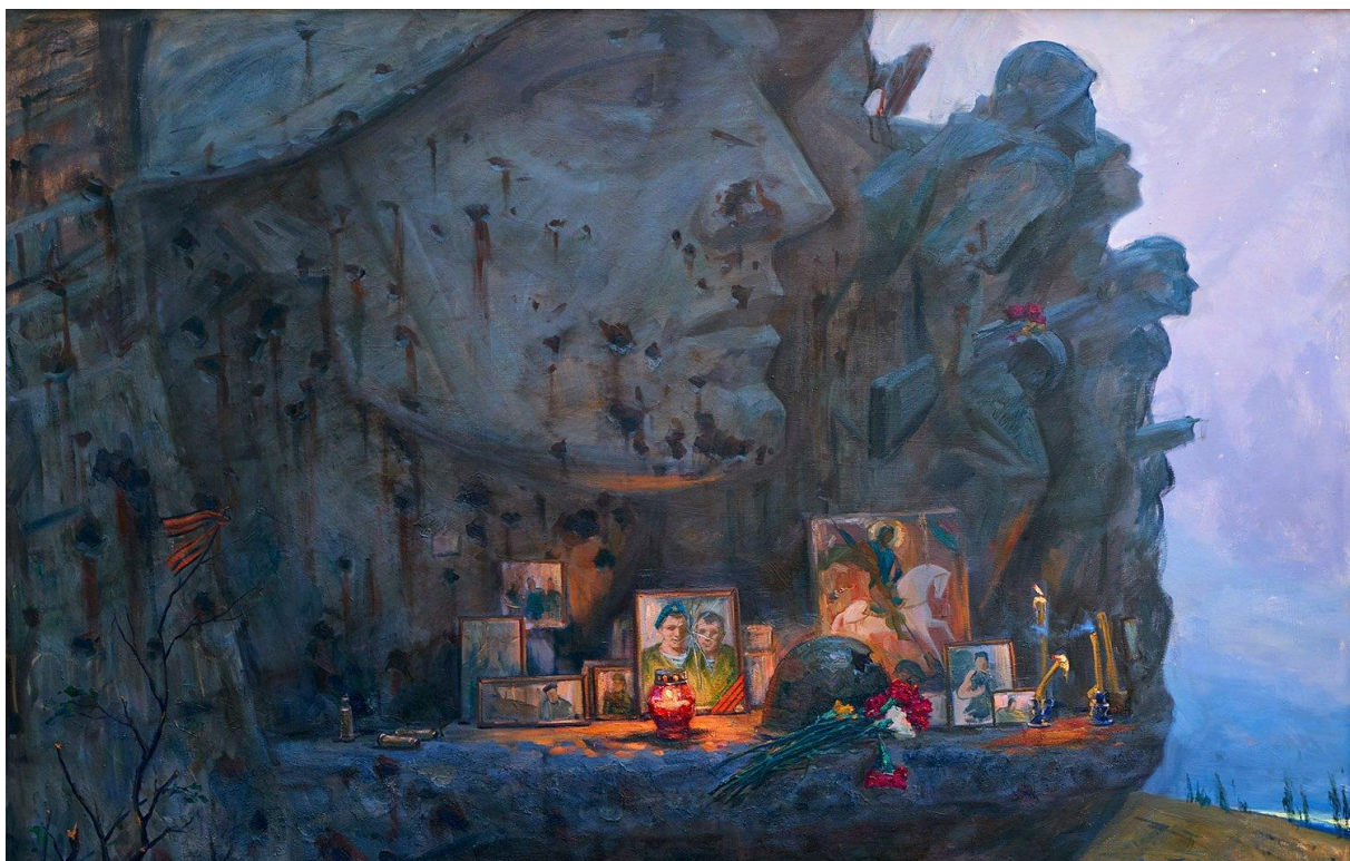
Рисунок 13. Безмолвие. Саур-Могила. Крюков А. 2017 г.