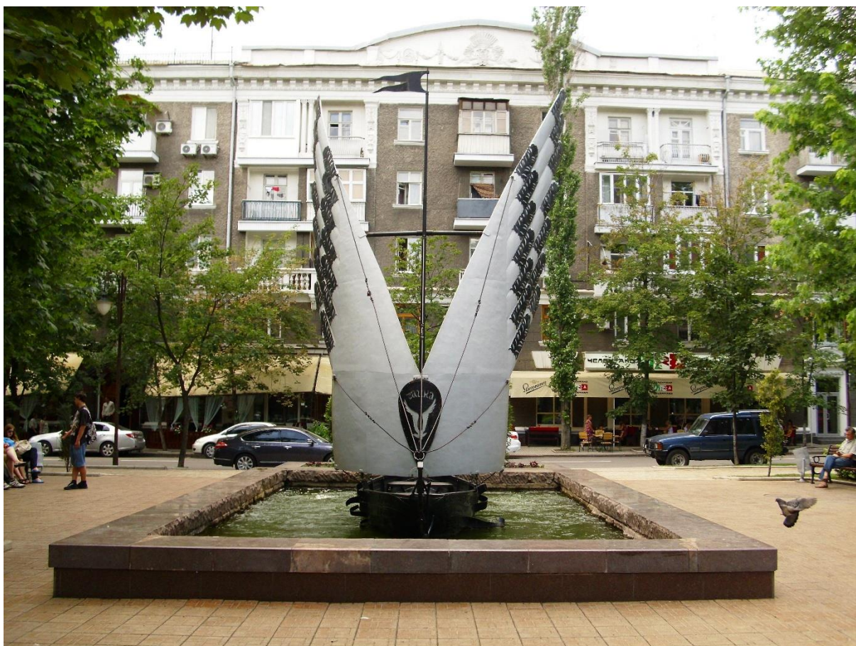
Рисунок 11. Фонтан-памятник «Реки Донбасса». Фото.

Конечно, самые крупные реки степного Донбасса не могут тягаться с Волгой или Енисеем: они входят в разряд малых и средних. Большая их