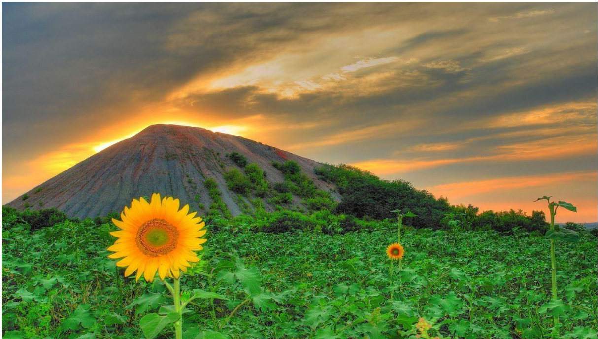
Рисунок 1. Автор неизвестен.