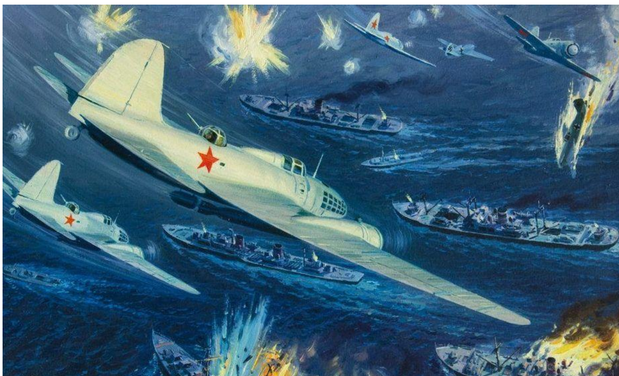
Рисунок 2. Воздушный бой. Мальцев П.Т., 1944 г.