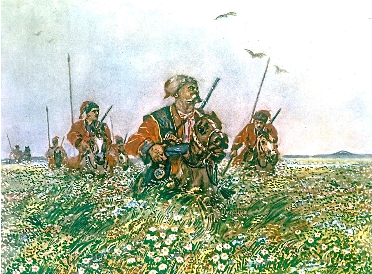
Рисунок 15. Тарас Бульба с сыновьями. С рисунка А.Герасимова.