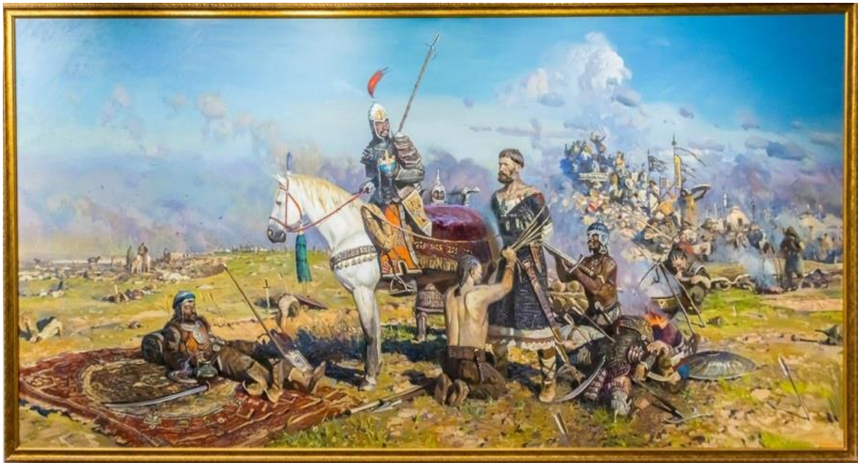
Рисунок 4. Рыженко П., «Калка», 1996 г.

4. Русь была поставлена перед выбором: ориентироваться на Запад, как предлагал князь Даниил Галицкий, или обратить взоры на Восток, как предлагал князь Александр. Предпочтение было отдано Александру, которому удалось наладить дипломатические отношения с татаро-монголами и сохранить Русь как государство.