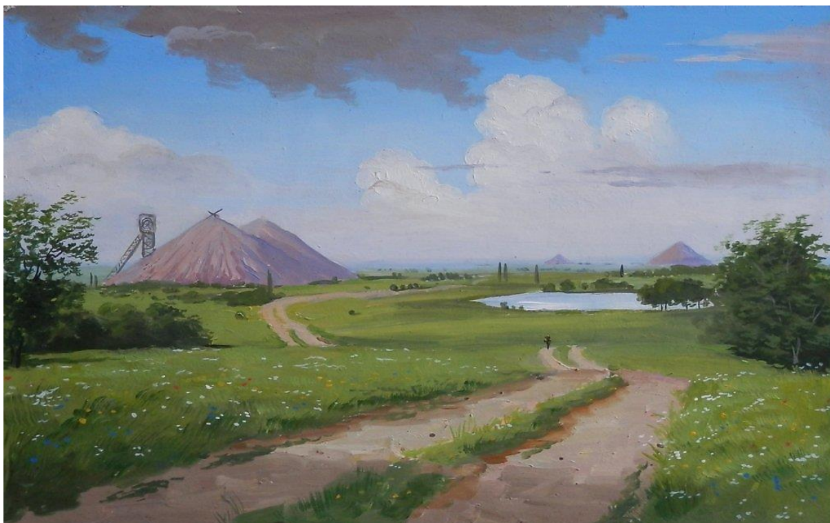
Рисунок 9. Терриконы Донбасса. Крюков А. 2014 г.

живём в тыловом районе. Я выросла уже заканчиваю школу и мечтаю о том что(бы) то время возвратилось назад.