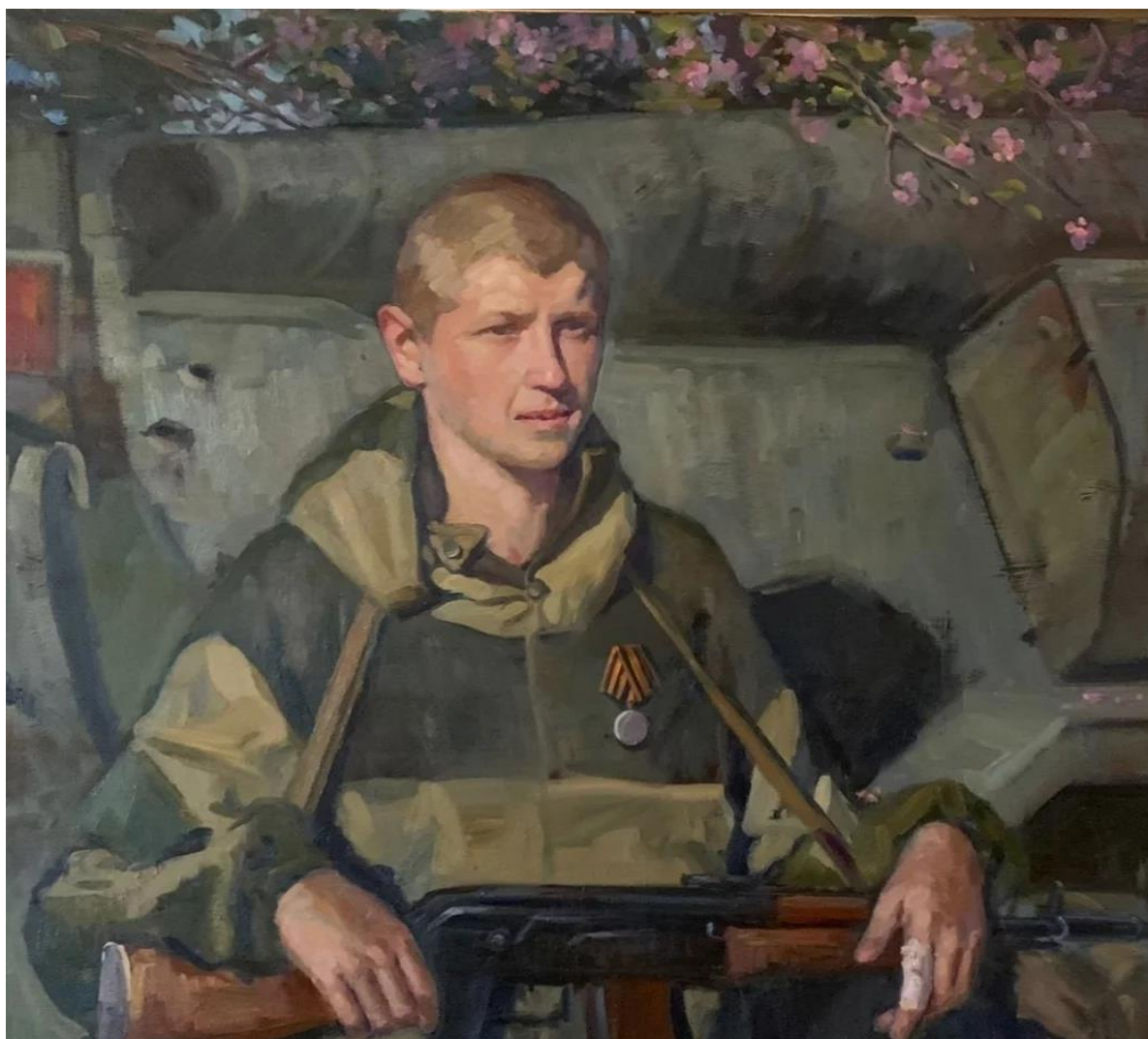
Рисунок 12. Донбасская весна. Крюков А. 2015 г.