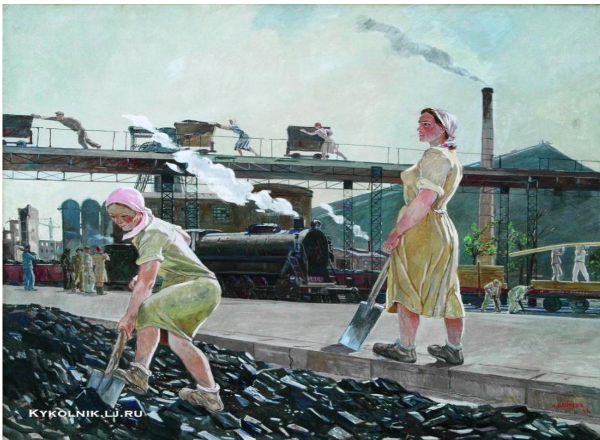
Рисунок 3. Донбасс. Дейнека А.А. 1947 г.