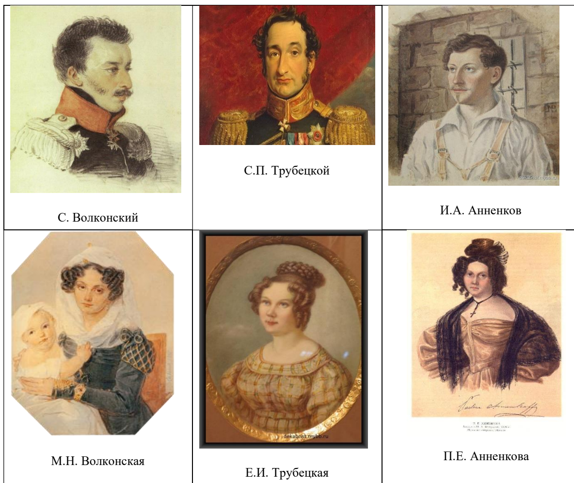
Рисунок 6. Портреты известных декабристов и их жён. Худ. Соколов П. и Бестужев Н.