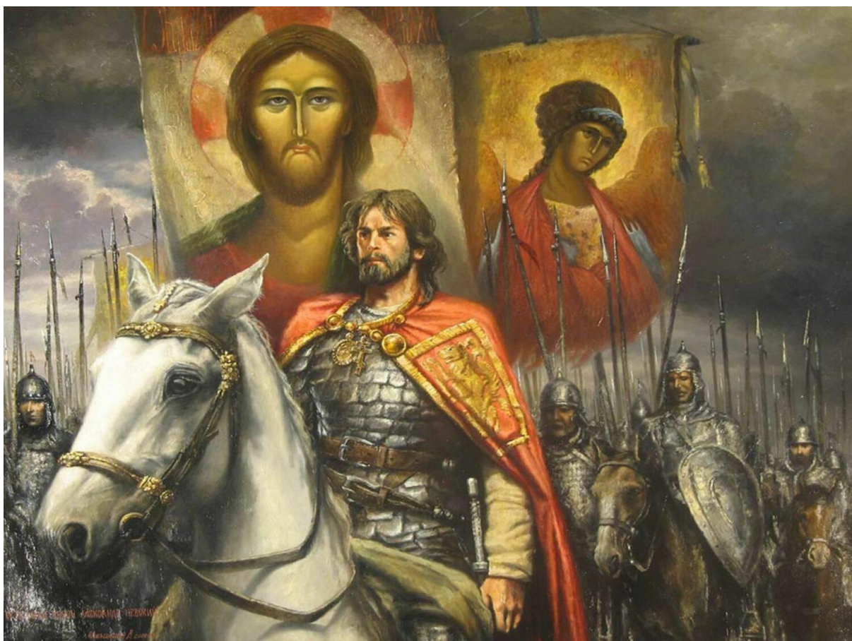
Рисунок 5. Невский перед боем. Меньшин В.

9. Считается, что после ледового побоища князь Александр получил титул "Невский". Папа Римский Иннокентий IV неоднократно уговаривал Александра подчиниться римскому престолу и получить взамен поддержку против татар. Он также предлагал королевскую корону Даниилу Галицкому. По рассказу летописца, Невский ответил: «Си вся съведаем добре, а от вас учения не принимаем» (Мы вас услышали, но вашу веру не принимаем).