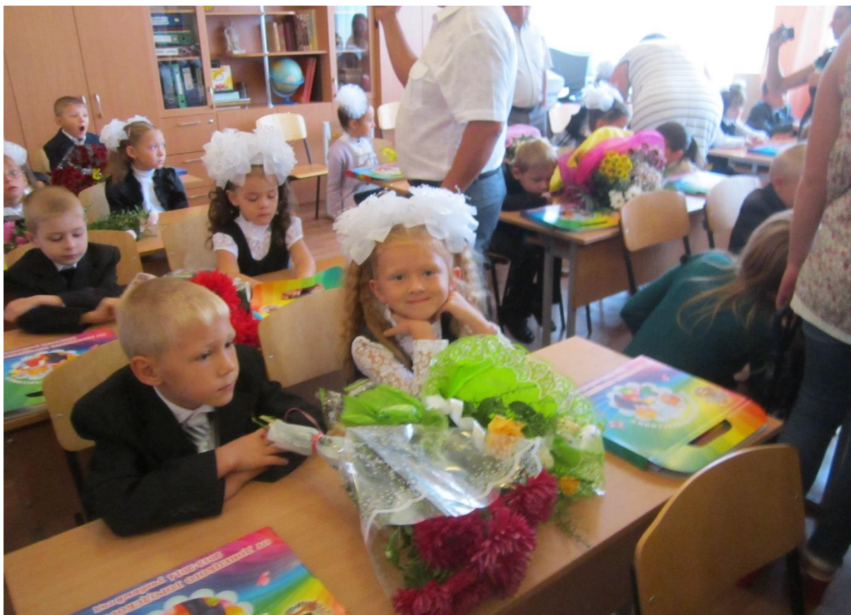
Рисунок 16. День знаний в первом классе 1 сентября 2013. Фото.

первокурсников так же актуален, как и для выпускников, ибо всестороннее развитие личности, как и любое поступательное развитие, идёт по спирали.