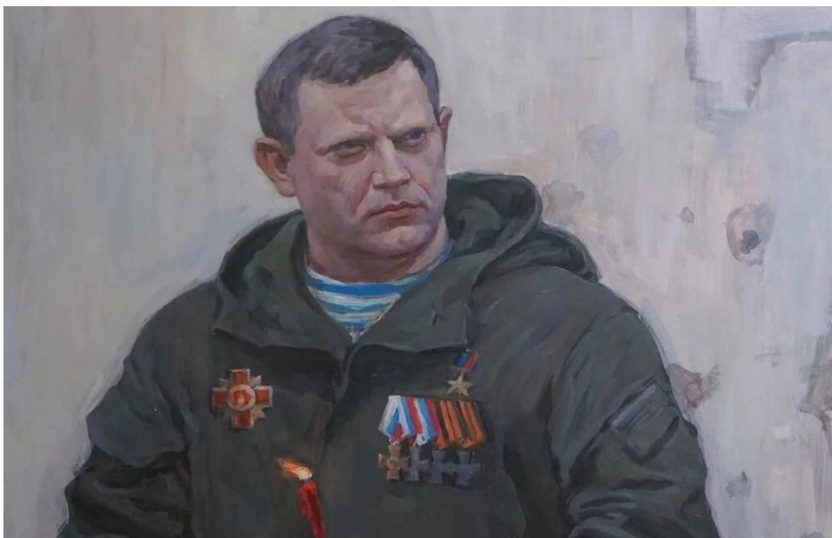
Рисунок 10. Портрет первого Главы ДНР А.В. Захарченко. Крюков А. 2018 г.

10. Буквально несколько дней назад, после освобождения от украинских неонацистов города Авдеевка, на месте гибели Бати, в центре Донецка, среди корзин с живыми цветами, которые постоянно приносят сюда дончане, появилась скромная записка на листе ватмана с написанными фломастером строками: «Батя, мы это сделали! Авдеевка наша!» Без подписи.