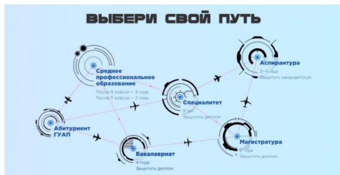
Рис. 3. Рекламное сообщение на сайте Санкт-Петербургского государственного университета аэрокосмического приборостроения

Взаимозависимую корреляцию вербального и невербального компонентов можно рассмотреть на примере рекламы Санкт-Петербургского государственного университета аэрокосмического приборостроения (рис. 3).