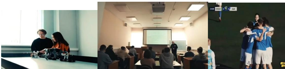
Рис. 4. Кадры из рекламного ролика

Казанского национального исследовательского технического университета имени А. Н. Туполева