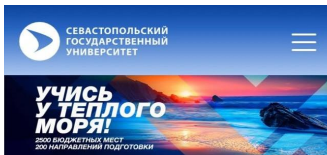
Рис. 2. Рекламное сообщение на сайте Севастопольского государственного университета

Рассмотрим еще один пример поликодового текста с данным типом корреляции (см. рис. 2).